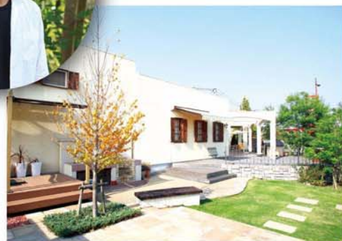
取材/広報委員会 (文)高橋 リエ

卒業後、日産自動車で修理工場の営業を担当。頑固一徹の経営者(一匹狼的な親父が多かったそう)に鍛えられた? 最初はケンモホロロだった頑固親父も、休みの日に工場の手伝いに行き、和菓子とお茶で次第に